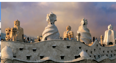
Casa Milà "La Pedrera"