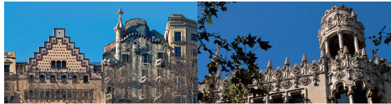
Casa Lleó Morera