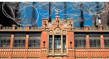
Editorial Montaner i Simon