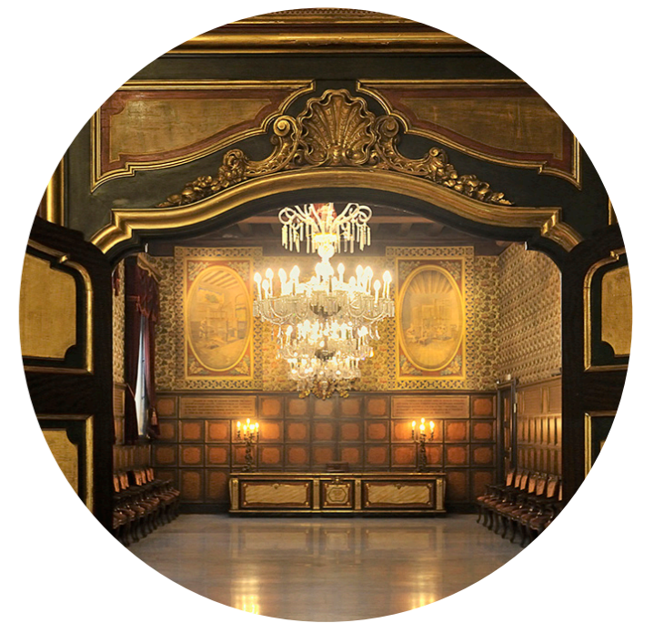
Casa de la seda

(Inicio: Punto de información de Turismo de Barcelona, Plaça de Catalunya, 17, sótano). M: Catalunya (L1, L3; FGC). Sáb 16.30-21.30h. Desde 44,10€ Ruta que combina recorridos a pie y en autobús por muchos de los lugares más famosos de Barcelona y una cena en el recinto modernista de Sant Pau, el espectáculo de luz, agua y color de la Fuente Mágica y las vistas nocturnas panorámicas desde Montjuïc.