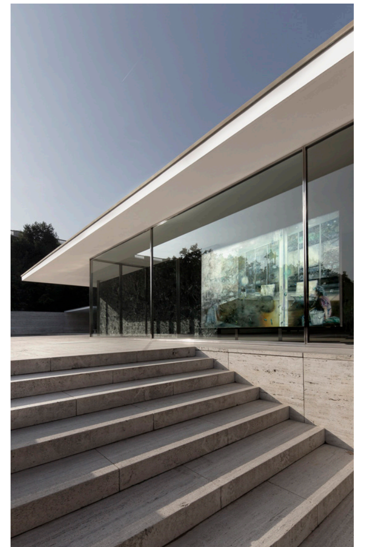
Pavelló Mies Van der Rohe