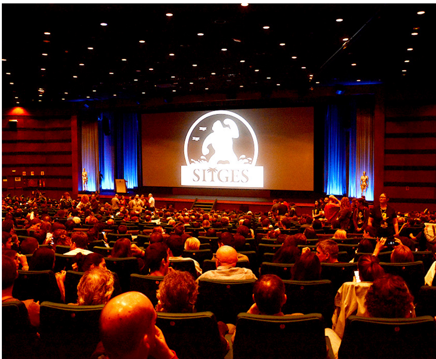
Festival Internacional de Cinema Fantàstic de Catalunya