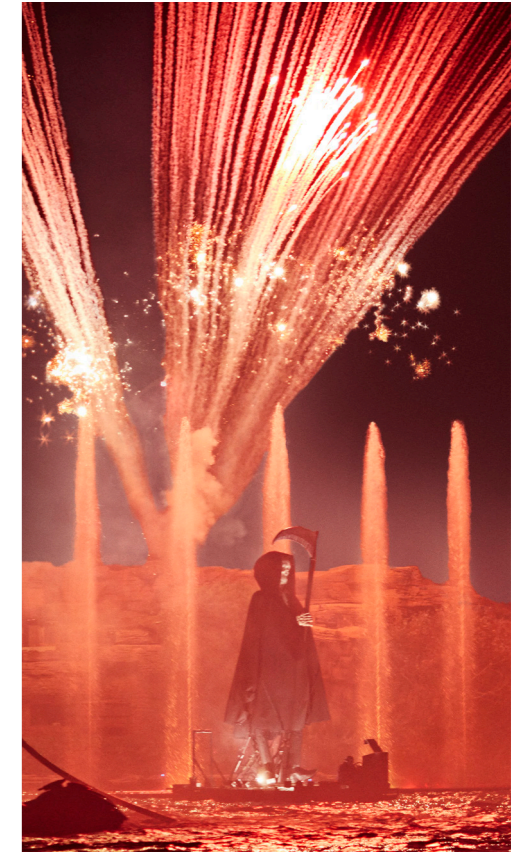
Halloween en PortAventura.