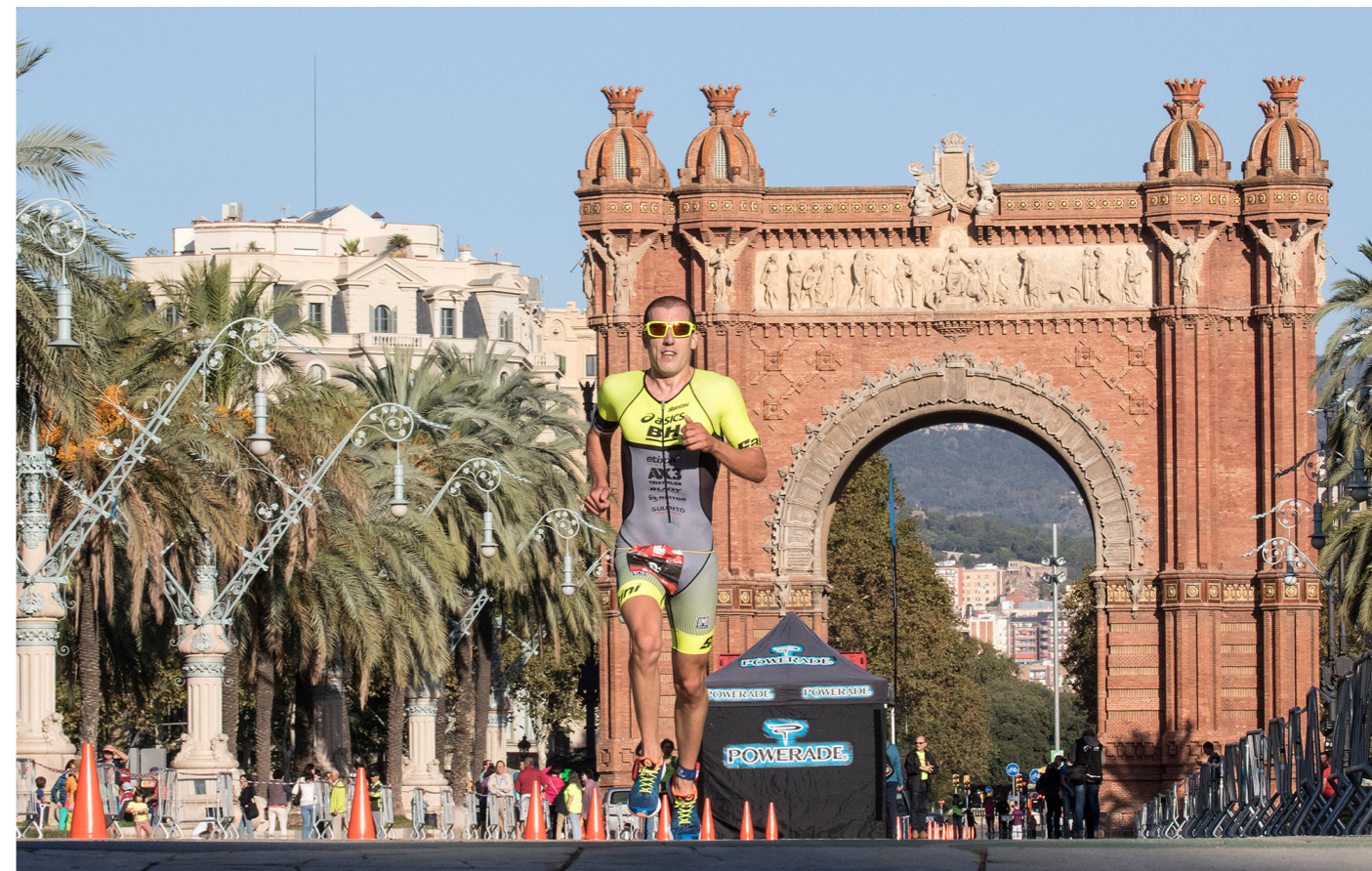
Triatlón de Barcelona