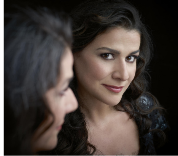
Cecilia Bartoli en el Palau de la Música Catalana