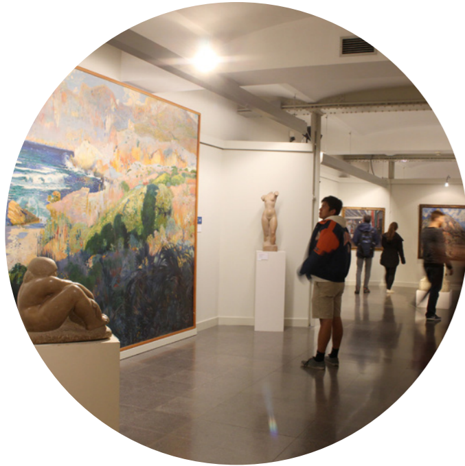
Museu de Montserrat