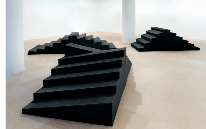
Obras abiertas. Arte en movimiento. La Pedrera