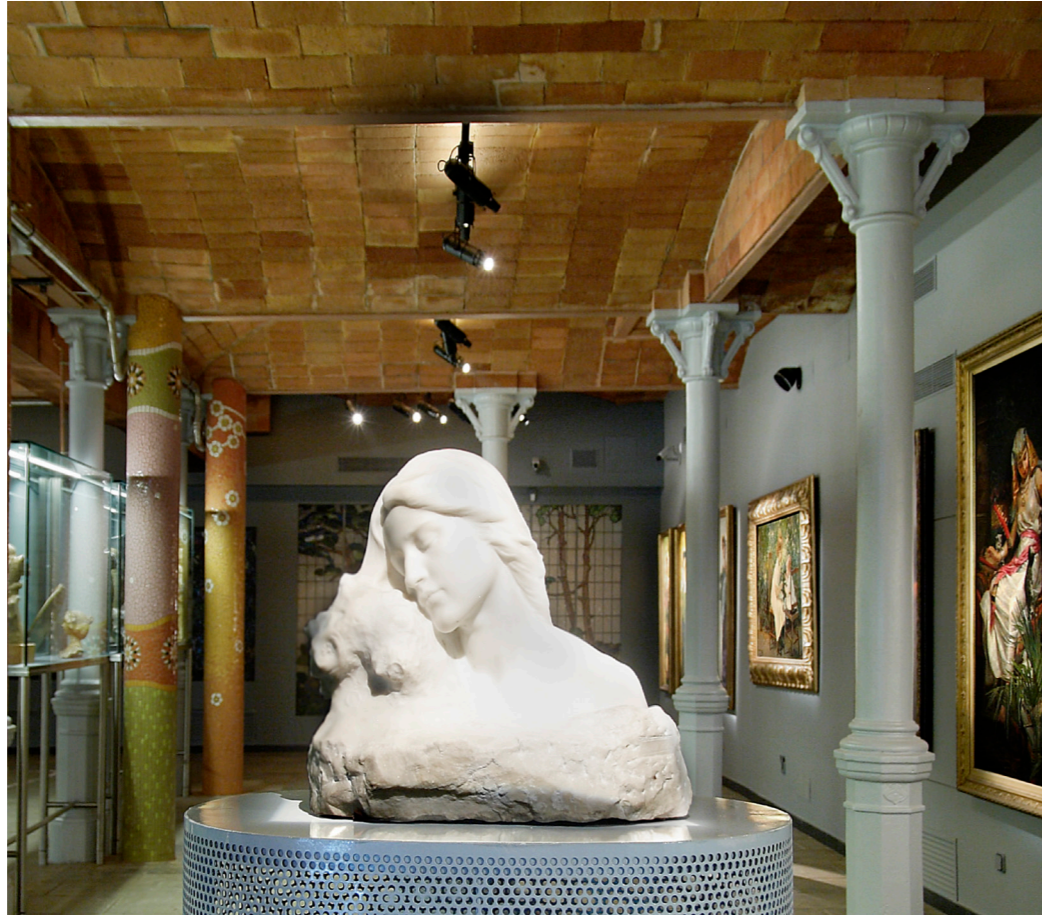
Museu del Modernisme

Hasta 24 feb. 50 años después de la muerte del fundador del Museo Picasso, Jaume Sabartés, la exposición reivindica a este amigo y confidente de Picasso, que desempeñó un papel clave en su prestigiosa carrera.