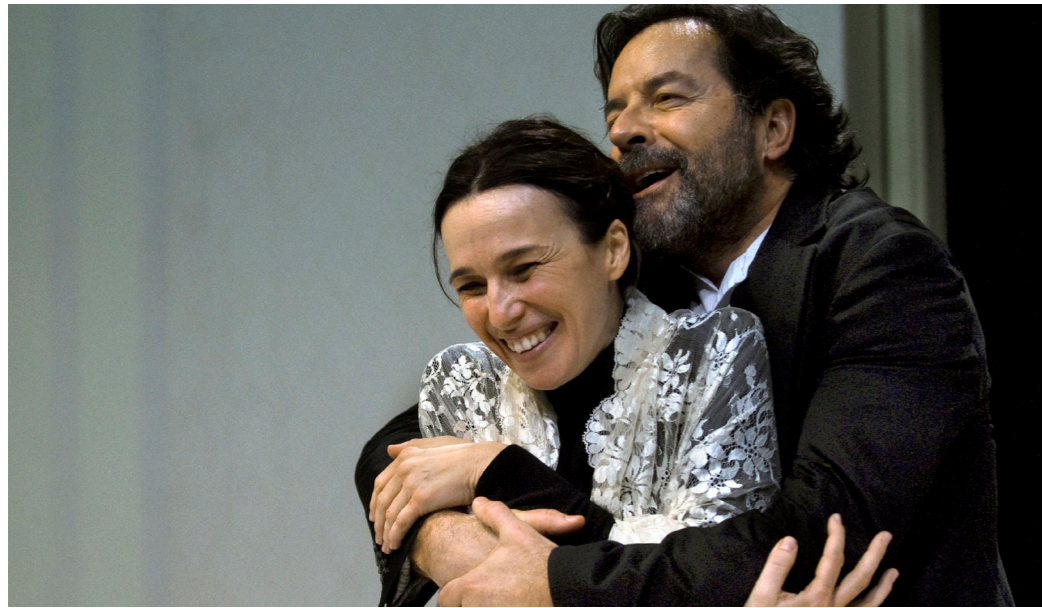
Jean Eyre. Teatre Lliure