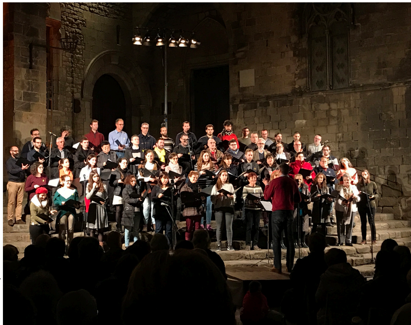
Orfeó Català, Plaça del Rei

Ha comenzado un nuevo año y en el mes de enero, cuando todos queremos estar recogidos y calentitos, encontrarás numerosos espacios seductores: cafés, restaurantes, tiendas, museos... El espíritu navideño aún permanece en algunos eventos, como la actuación del Orfeón catalán, que interpreta villancicos en la Plaça del Rei el 3 de enero. Es también momento de tradiciones. Para muchos niños, el mayor acontecimiento del año es la llegada de los Reyes Magos el 5 de enero, que se celebra con una enorme cabalgata por el centro de la ciudad. El Día de Reyes, 6 de enero, es típico comer el "roscón de Reyes". Y en torno al 17 de enero, los catalanes rinden homenaje al santo patrón de los animales con las festividades de los "Tres Tombs".