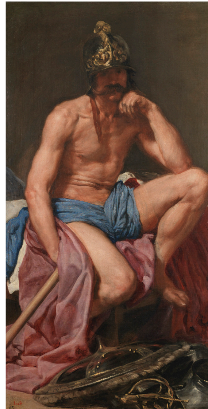
Diego Velázquez. Marte © Museo Nacional del Prado. CaixaForum

exposición en solitario en España del artista turco Erkan Özgen y toma como inspiración su última película, Purple Muslim, un documental sobre mujeres yazidi que escaparon de las fuerzas del ISIS y Al-Sham y buscaron refugio en el norte de Irak. Explora el impacto de la guerra en las refugiadas que huyen de zonas de conflicto.