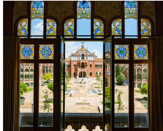
Sant Pau Recinte Modernista

(Camí de l'Observatori, s/n). Para llegar hace falta coche o taxi. Desde 11 ene: visitas guiadas nocturnas: vie (cat/es), sáb (cat/es/ing). 15€/25€. www.sternalia.com Dirígete al observatorio de Barcelona, en la ladera de la montaña, para una visita guiada nocturna, además de la