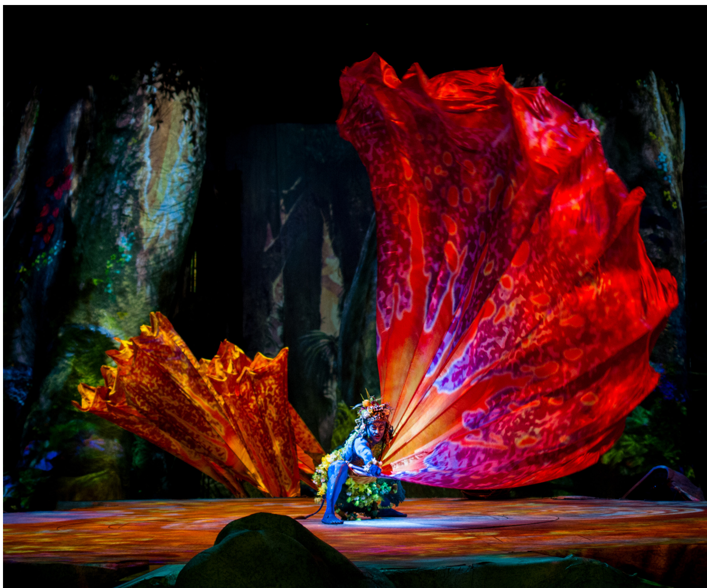
Cirque du Soleil. Palau Sant Jordi