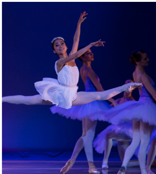
Don Quixote. Ballet de Catalunya