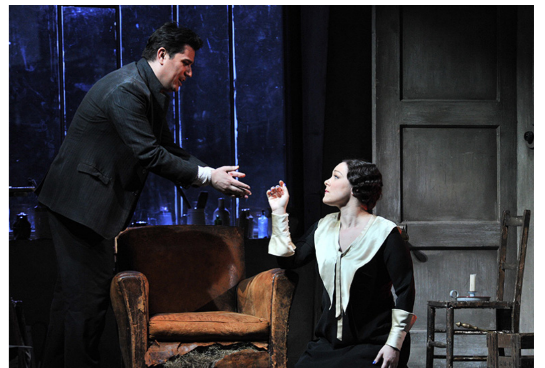
La Bohème. Museu Europeu d'Art Modern

Teatre Poliorama (La Rambla 115) M: Catalunya (L1, L3; FGC). Palau de la Música Catalana (Palau de la Música 4-6). M: Urquinaona (L4). Estas salas ofrecen representaciones de dos espectáculos que celebran la belleza de dos géneros musicales. El primero, Ópera y flamenco , es la tormentosa historia de amor entre bailaores flamencos que interpretan algunas de las arias más famosas de la ópera. El otro, Gran Gala Flamenco , ofrece la oportunidad de oír el flamenco más clásico y tradicional, en una interpretación intensa llena de pasión y ritmo.