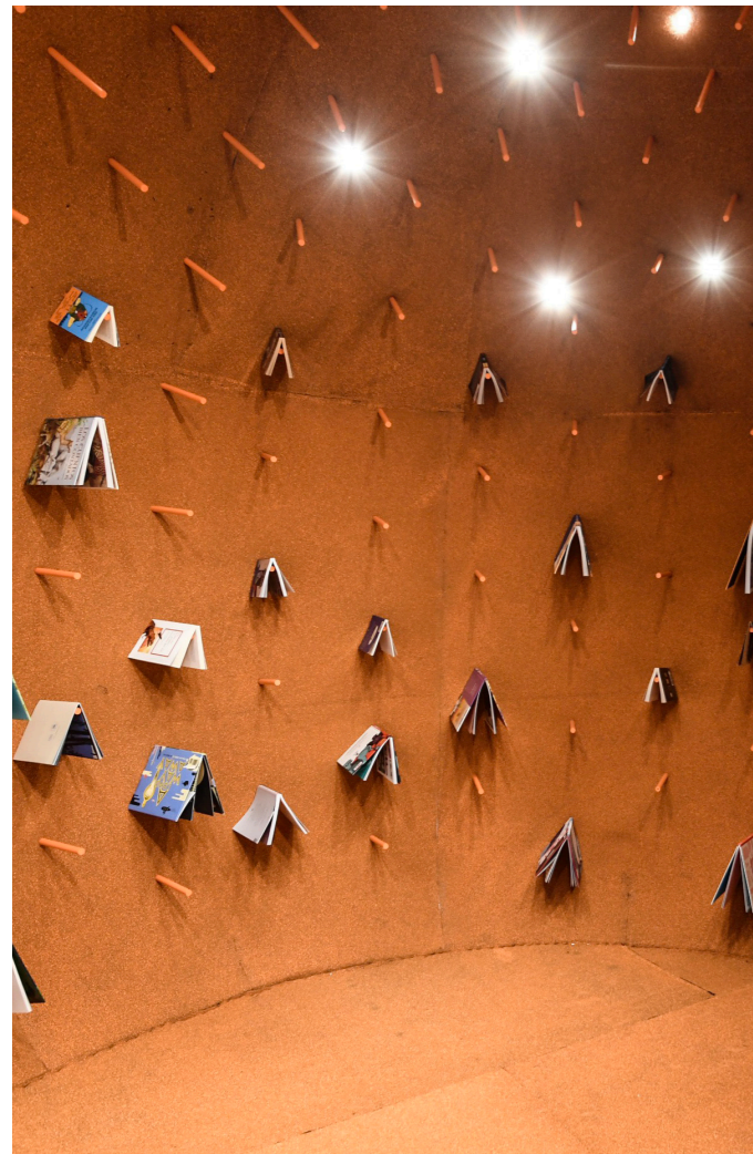
Al descubierto o a escondidas. MACBA

el Epon Photography y el International Photography, ambos en 2009.