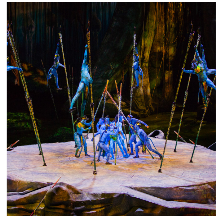
Toruk. Cirque du Soleil. Palau Sant Jordi

18-20, 25-27 ene. 21.30; dom 16.30h. Desde 34€. Esta producción del Cirque du Soleil, creada en 2015, se inspira en la exitosa película de James Cameron, Avatar. El protagonista, Toruk, es uno de los muchos personajes que aparecen como marionetas de tamaño natural en un espectáculo en el que no pueden faltar las famosas acrobacias de la compañía.