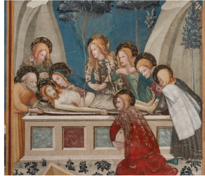
Murals divins. Reial Monestir de Pedrabes

Esportclick Hasta 7 oct. En el vestíbulo del museo, contempla la vitrina de muñecos de Playmobil que conmemoran las Olimpiadas