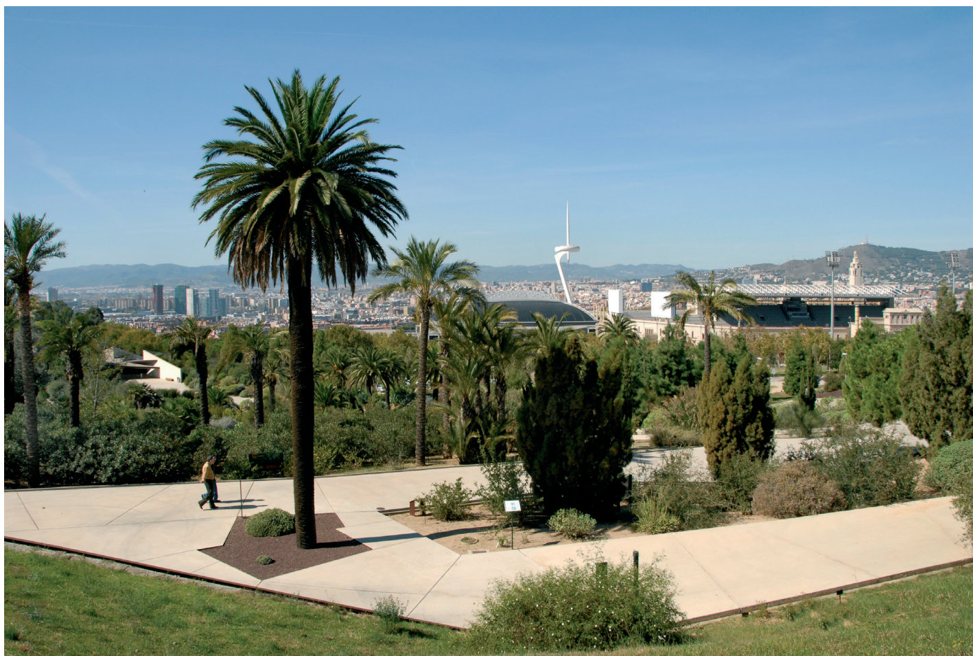
Parcs i Jardins de Barcelona / Jardí Botànic