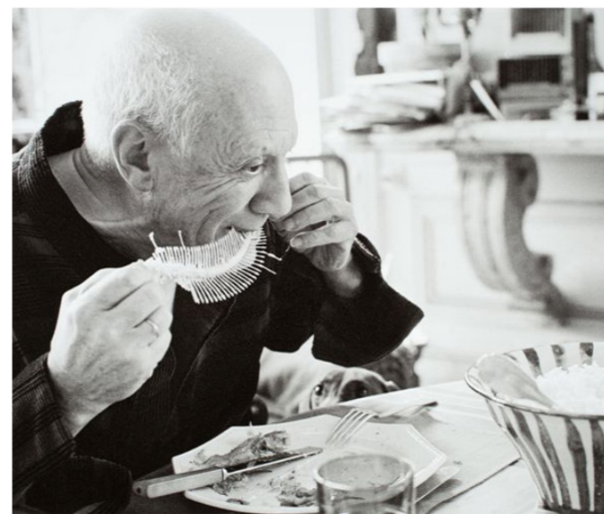
La cocina de Picasso. Museu Picasso

de Invierno celebradas este año en PyeongChang.