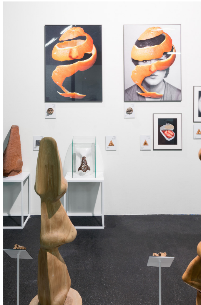
Nasevo. Museu de Ciències Naturals de Barcelona

del archivo del MACBA, esta exposición explora los problemas de la representación y sus límites, así como la importancia e incidencia del artista y el arte en la sociedad contemporánea.