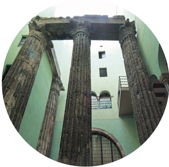
MUHBA Temple d'August