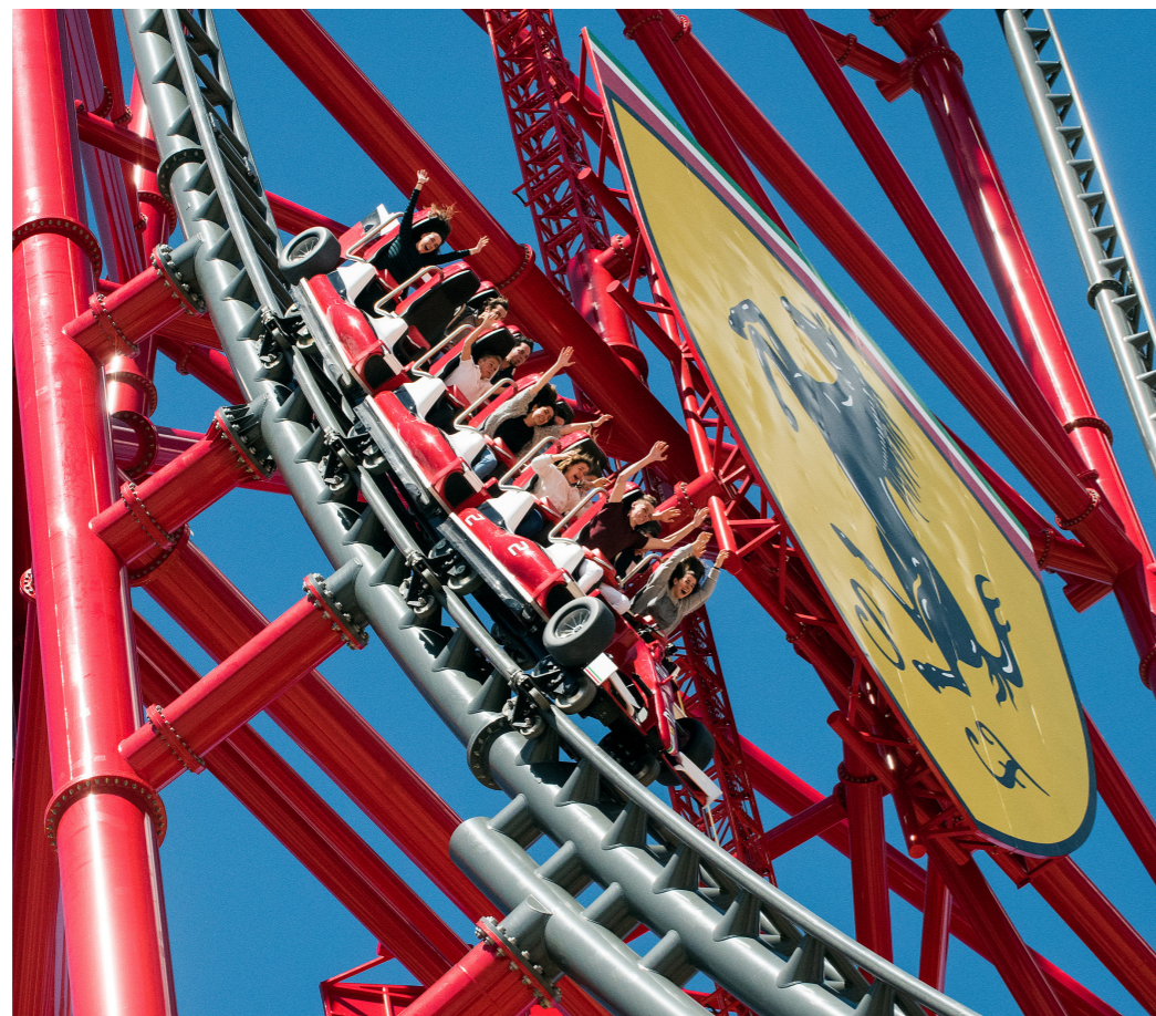
Ferrari Land. Port Aventura World

(Inicio: Plaça Catalunya esquina con Rambla Catalunya delante de la tienda de Desigual). M: Catalunya (L1, L3; FGC). Diario (excepto sáb) 10-16h. Desde 44.10€. Sube a las montañas de Montserrat en el cremallera y disfruta de una visita guiada a este lugar sagrado con su monasterio benedictino y su estatua de la Virgen de Montserrat, todo ello acompañado por el coro de los niños de la Escolanía, internacionalmente conocidos.