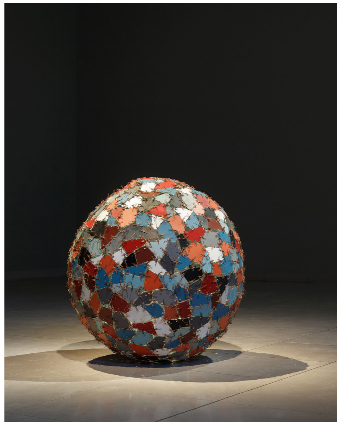
Chaos + Repair = Universe. Kadder Attia. Fundació Joan Miró