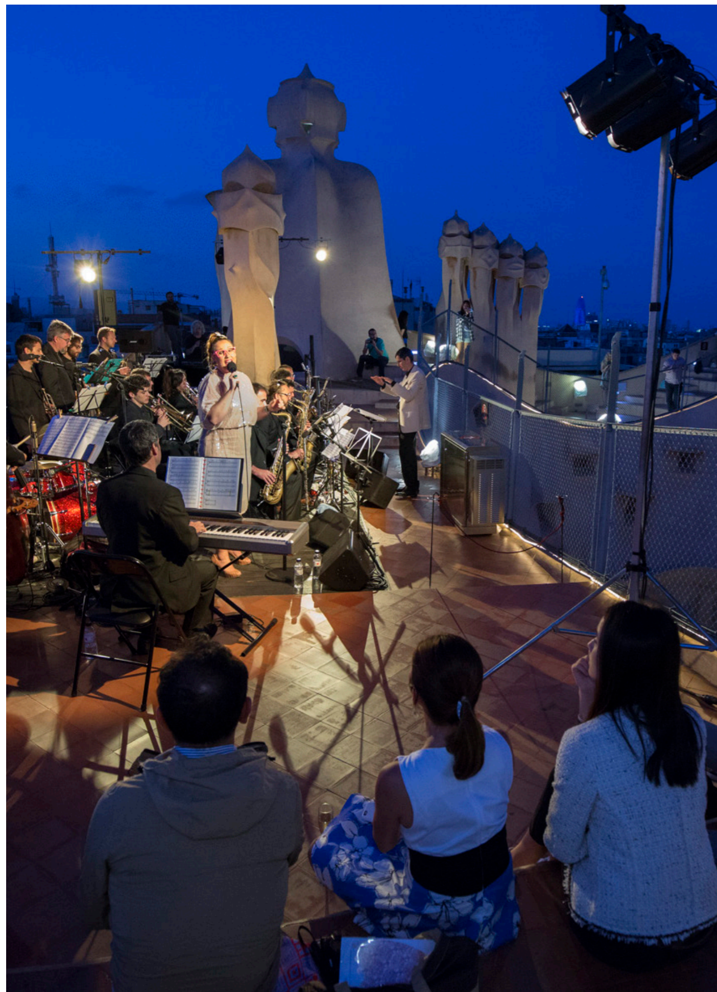
Noches de jazz en La Pedrera