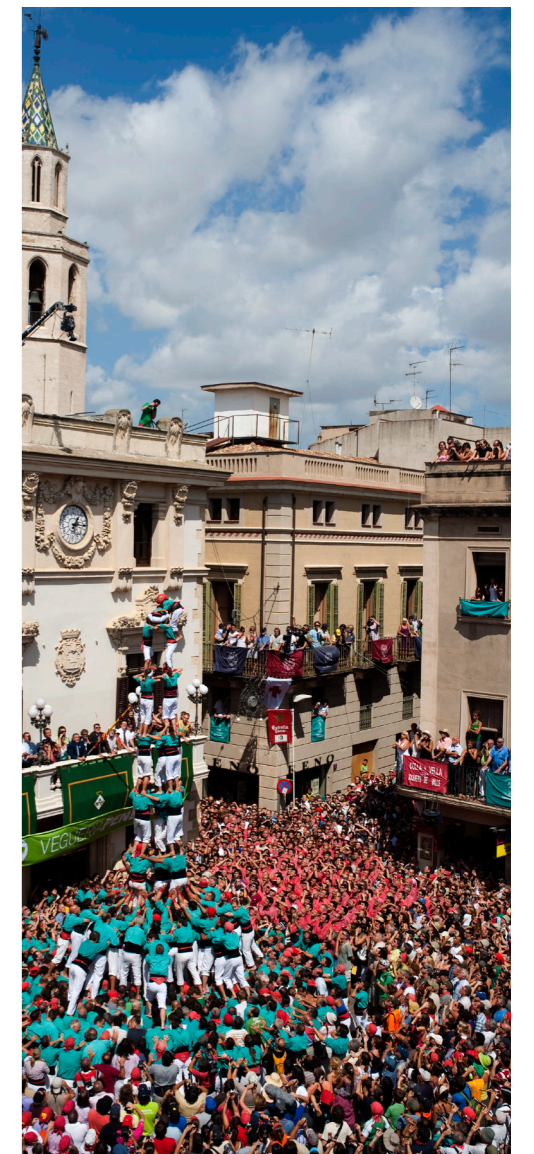
Castells de Vilafranca

Si quieres vivir una auténtica experiencia catalana, acércate en tren a Vilafranca a finales de agosto. Además de disfrutar de la visita a un bonito pueblo en el corazón de la región vinícola del Penedès, podrás conocer su fiesta major , unirse a las celebraciones y admirar los increíbles "castells" (torres humanas). El 30 de agosto, día del santo patrón Sant Fèlix, las muchedumbres se reúnen en la plaza principal para ver y construir los "castells", que se alzan a medida que los participantes suben unos a hombros de otros; el "castell" termina cuando el niño más pequeño del grupo llega a lo más alto y levanta la mano, obteniendo el gran aplauso de los espectadores.