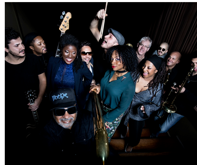
Incognito en el Teatre Coliseum

La escena musical de Barcelona se mantiene viva durante la tradicional tranquilidad del mes de agosto gracias al Mas i Mas Festival , que cumple ya 16 años, con su extenso programa de conciertos en diferentes espacios de la ciudad. En el Teatre Coliseum , actúan músicos nacionales e internacionales de acid jazz, groove, swing, soul y funk, mientras que el Jamboree ofrece todos los días una sesión doble de jazz con artistas también nacionales e internacionales. En la sala Tarantos , durante todo agosto, actúan dos hermanos que a pesar de sus 19 y 18 años ya son dos estrellas del flamenco. Y si lo tuyo es el techno, consulta el programa diario en el emblemático club Moog . Este año, por primera vez, se celebra durante la semana de apertura del festival la Global Music Foundation Barcelona '18 , una semana de conciertos, talleres y seminarios para estudiantes de música, además de sesiones after-hours. En el Jamboree aparecerán artistas de primer nivel mundial, y en la Plaça Reial habrá actuaciones gratuitas al aire libre.