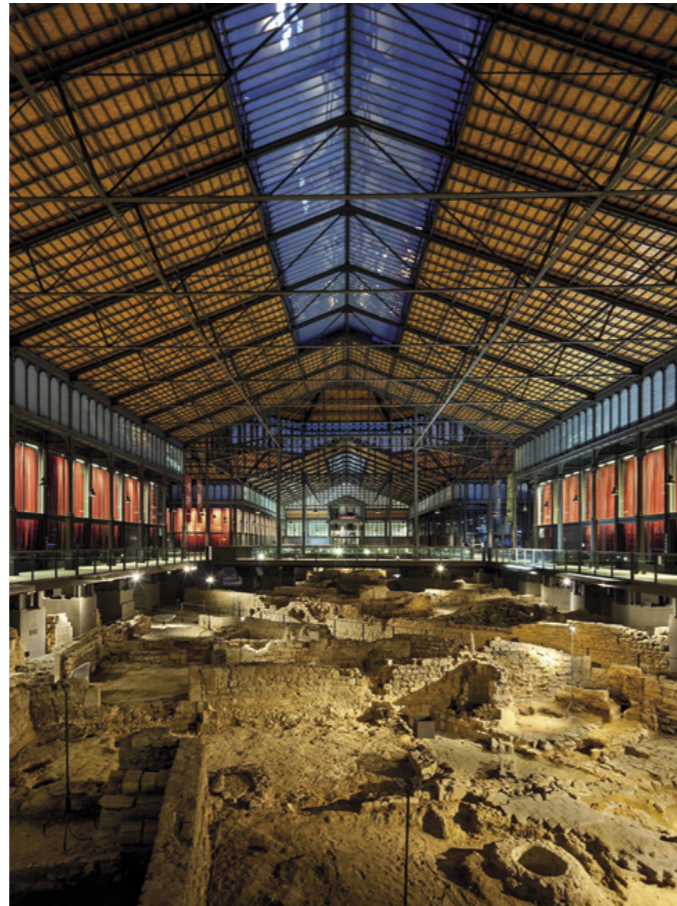
El Born Centre de Cultura i Memòria

(Isaac Newton, 26). FGC: Av. Tibidabo. Diario 10-20h. www.cosmoaixa.com