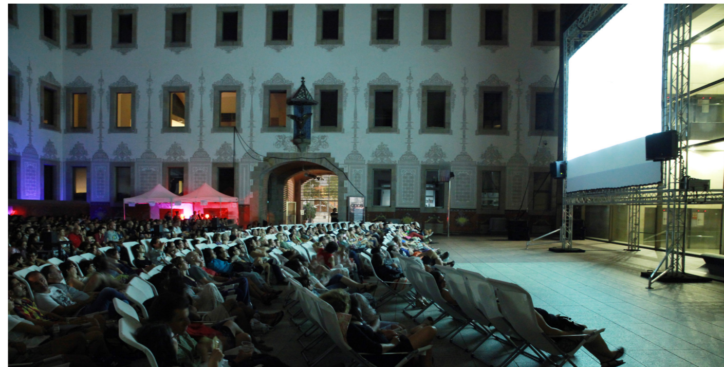
Gandules en el CCCB