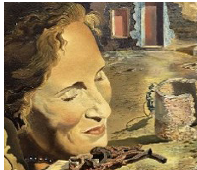
Gala Salvador Dalí. Museu Nacional d'Art de Catalunya