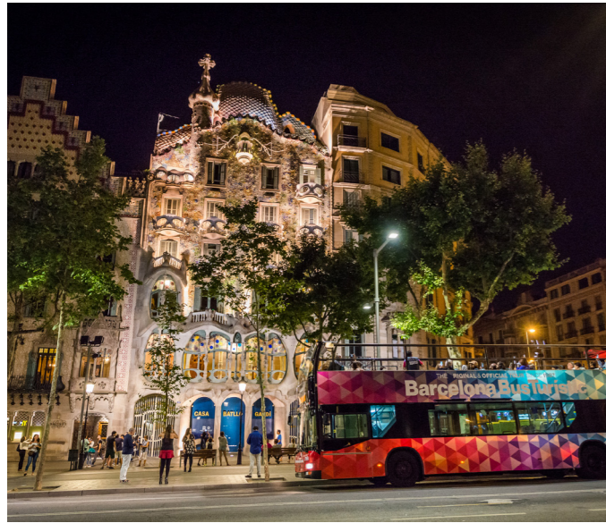
Barcelona Nigth Tour

El despertar de La Pedrera: mié, jue, vie (ing) 8h. 39€. Muchos barceloneses la consideran la verdadera obra maestra de Gaudí. Las líneas onduladas de la fachada, el impresionante terrado y los originales rasgos interiores son de visita imprescindible.