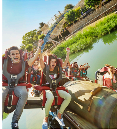
Port Aventura Park

Si buscas un día de diversión incesante, PortAventura World te ofrece tres increíbles parques temáticos. PortAventura Park , con atracciones, aventuras y emociones para todas las edades, distribuidas en seis mundos: Mediterráneo, México, Far West, China, Polinesia y Sésamo Aventura. Más de 40 atracciones y 100 espectáculos diarios que incluyen montañas rusas, paseos en barco y tren, desfiles, fuegos artificiales y experiencias 4D. Los amantes de los coches de carreras no pueden perderse Ferrari Land , el primero y único de su clase en Europa, que rinde homenaje a la famosa escudería italiana con toda una serie de atracciones y actividades a toda velocidad en las que sentir la adrenalina. Este año se ha abierto una nueva Zona Infantil, para que los aficionados más jóvenes puedan probar de primera mano el sabor de la carrera. Y con las altas temperaturas de agosto, ¿qué mejor que refrescarse en PortAventura Caribe Aquatic Park ? Numerosos toboganes, piscinas y dos playas especiales garantizan toda clase de emociones acuáticas además de la oportunidad de relajarse. En las oficinas de turismo de Barcelona y en la web de Barcelona Turisme se pueden comprar tres entradas diferentes para PortAventura: excursión desde Barcelona en autocar con aire acondicionado y entrada a PortAventura Park; el mismo transporte más la entrada a PortAventura Park y Ferrari Land o, si lo prefieres, solo la entrada a los parques de tu elección .