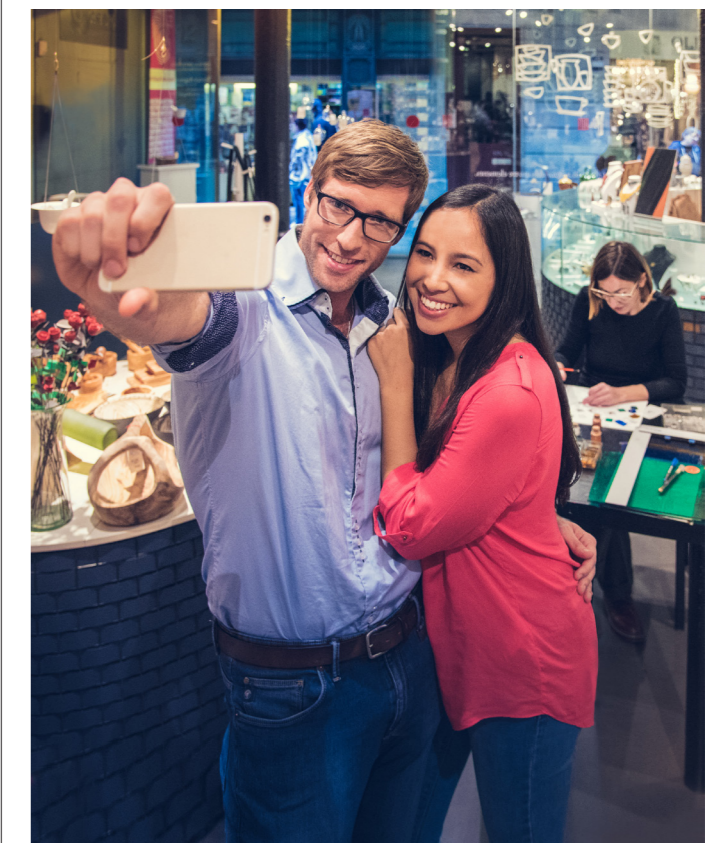
Barcelona Genuine Shops

Barcelona Bosc Urbà BUY (Plaça del Fòrum, s/n). M: El Maresme/Fòrum (L4). Diario 10-15h, 16-20h. Desde 11€. Diversión para todas las edades, con tirolinas, puentes y plataformas de seis metros de altura.