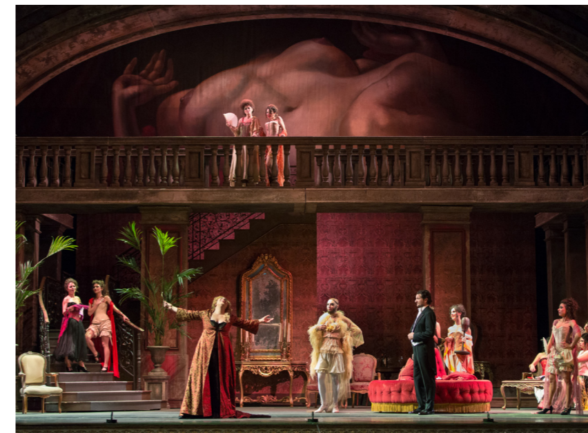
Manon Lescaut. Gran Teatre del Liceu

Junio es un mes magnífico en Barcelona para los aficionados a la música clásica, con toda una serie de conciertos de primer orden, que cierran la agenda de la temporada de Barcelona Obertura Classic & Lyric , una iniciativa que busca poner en valor los excelentes auditorios de ópera, recitales y música coral de la ciudad ( www.barcelonaobertura.com ). La semana de música comienza con el maestro Kazushi Ono dirigiendo a la Orquesta Sinfónica de Barcelona en su primera interpretación del "Requiem" de Dvorak (L'Auditori, 3 jun). El siguiente en el programa es el afamado tenor francés Philippe Jaroussky , que vuelve al Palau de la Música Catalana tras su exitosa actuación del año pasado para interpretar al protagonista de "Orfeo ed Euridice" de Gluck (Palau de la Música, 5 jun). Cierra la temporada en el magnífico auditorio del Liceu una producción de " Manon Lescaut " de Puccini; la noche de inauguración forma parte del programa de Obertura Classic & Lyric (Gran Teatre del Liceu, 7 jun. Más representaciones en www.liceubarcelona.cat/es ). La tarde siguiente el prestigioso director británico sir Simon Rattle se pone al frente de la Berlin Philharmoniker (Palau de la Música Catalana, 8 jun). Y como remate tenemos una velada de hermosa música de Händel con la orquesta Hesperion XX y el director catalán Jordi Savall (L'Auditori, 10 jun).