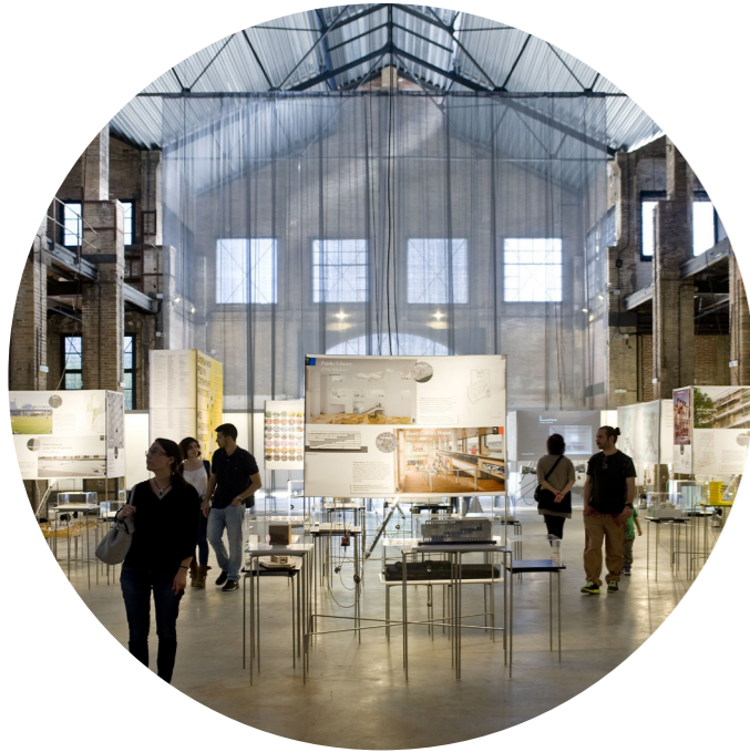
Interrogar Barcelona. MUHBA Oliva Artés