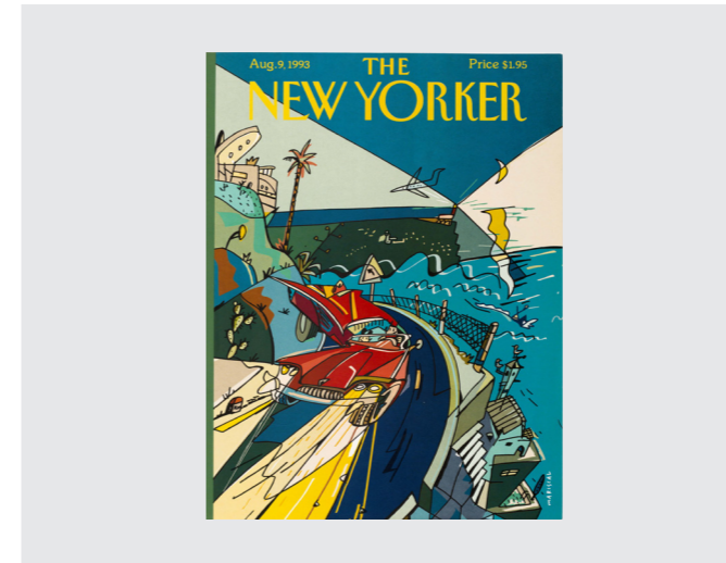
¿Diseñas o trabajas? Javier Mariscal. Museu del Disseny

Hasta 3 jun. Amplia exposición de la obra de la escultora barcelonesa Luisa Granero (1942-2012).