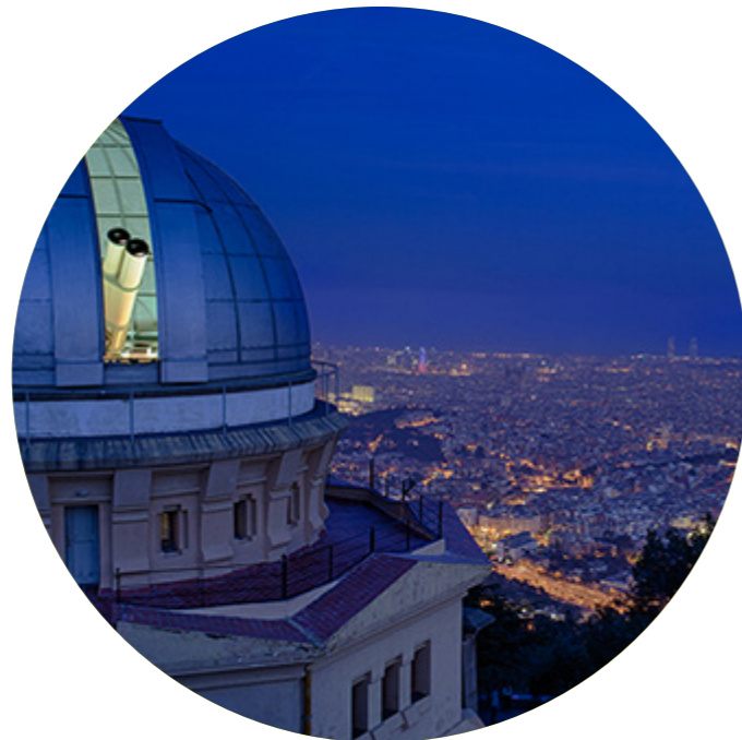
Sopars amb estrelles

(La Rambla, 115). M: Catalunya (L1, L3; FGC). Miér,