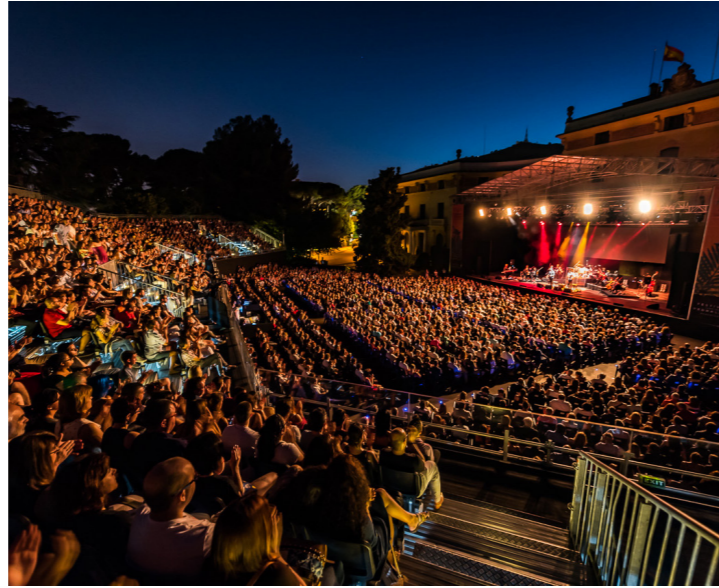
Festival Jardins de Pedralbes

En junio la temporada de festivales empieza a caldearse en Barcelona, en todos los sentidos de la palabra, puesto que se va notando la subida de los termómetros. Sin duda uno de los mayores eventos del mes es el Sónar , el festival de la música, la creatividad y la tecnología, que este año será mejor que nunca, puesto que celebra su 25 edición. El cartel de las actuaciones de Sónar de Día y Sónar de Noche es verdaderamente seductor, con Gorillaz, Thom Yorke, 2manydjs, Miss Kittin, Laurent Garnier y LCD Soundsystem, entre la larga lista de artistas programados. Pero el Sónar es mucho más que sus conciertos. Una exposición muestra obras de arte del Sónar de los últimos 25 años, mientras que Sónar+D ofrece a los profesionales la oportunidad de explorar nuevas tecnologías y proyectos en el sector creativo (14-16 jun; https://sonar.es/ ). Otro gran festival que comienza este mes es el Festival Jardins de Pedralbes , que tiene lugar en los preciosos jardines del Palacio Real de Pedralbes. Oír aquí un concierto nocturno de artistas como Simple Minds (11 jun), Mariza (13 jun), Sara Baras (14 y 16 jun), Jessie J (19 jun), Tom Jones (24 jun), Jeff Beck (28 jun) o ZAZ (29 jun) es una experiencia memorable (6 jun-13 jul; www.festivalpedralbes.com ).