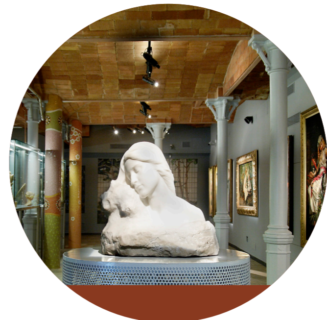
Museu del Modernisme de Barcelona