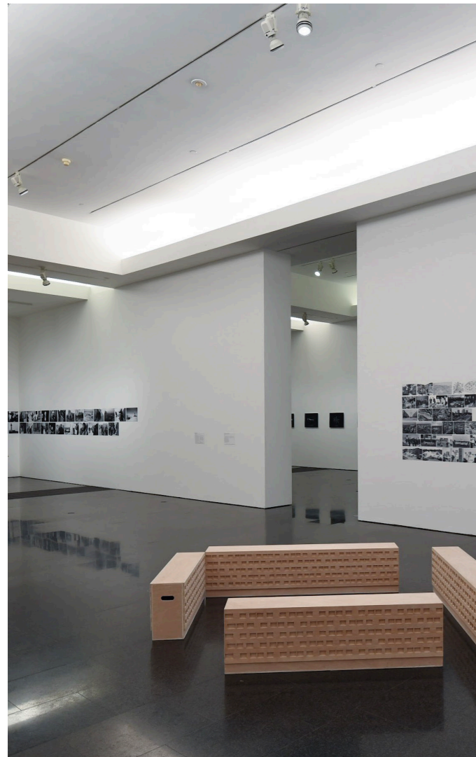
Domènec. MACBA.