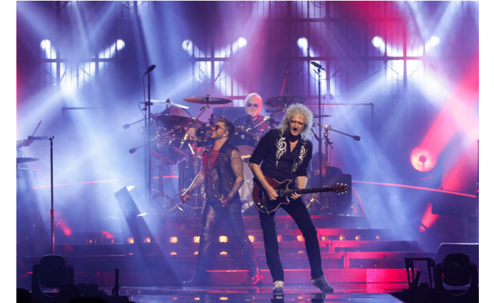
Queen + Adam Lambert. Palau Sant Jordi

(Balmes, 139). M: Diagonal (L3, L5); Provença (FGC). Diario 18h, 19.50h, 21.40h (los espectáculos empiezan más tarde). Opciones: solo espectáculo, espectáculo + bebida, espectáculo + distintas