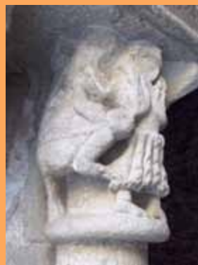
Above, eight of cloister column capitals. Below, a mysterious toad at foot of a column