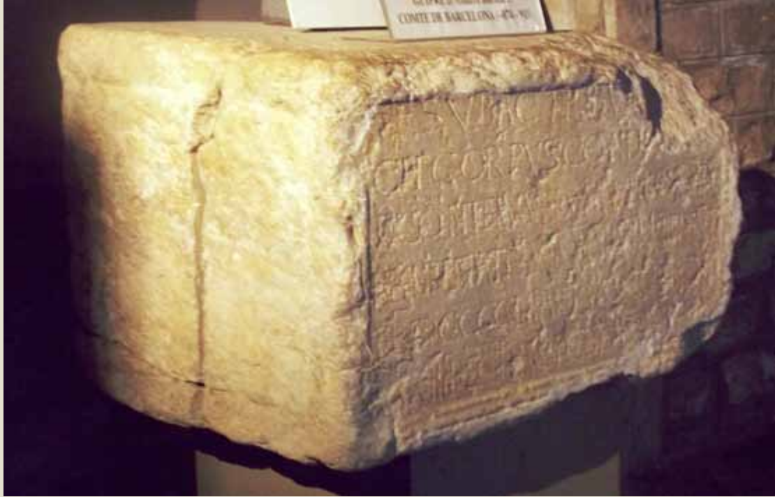
The tombstone of Guifré II, Count of Barcelona

Guifré II was the son of Guifré the Hairy, who legend says is in the quatre barres (the four red vertical stripes of Catalan flag) origin, when Charles II the Bald ran their fingers wet with the Earl's blood for his coat.