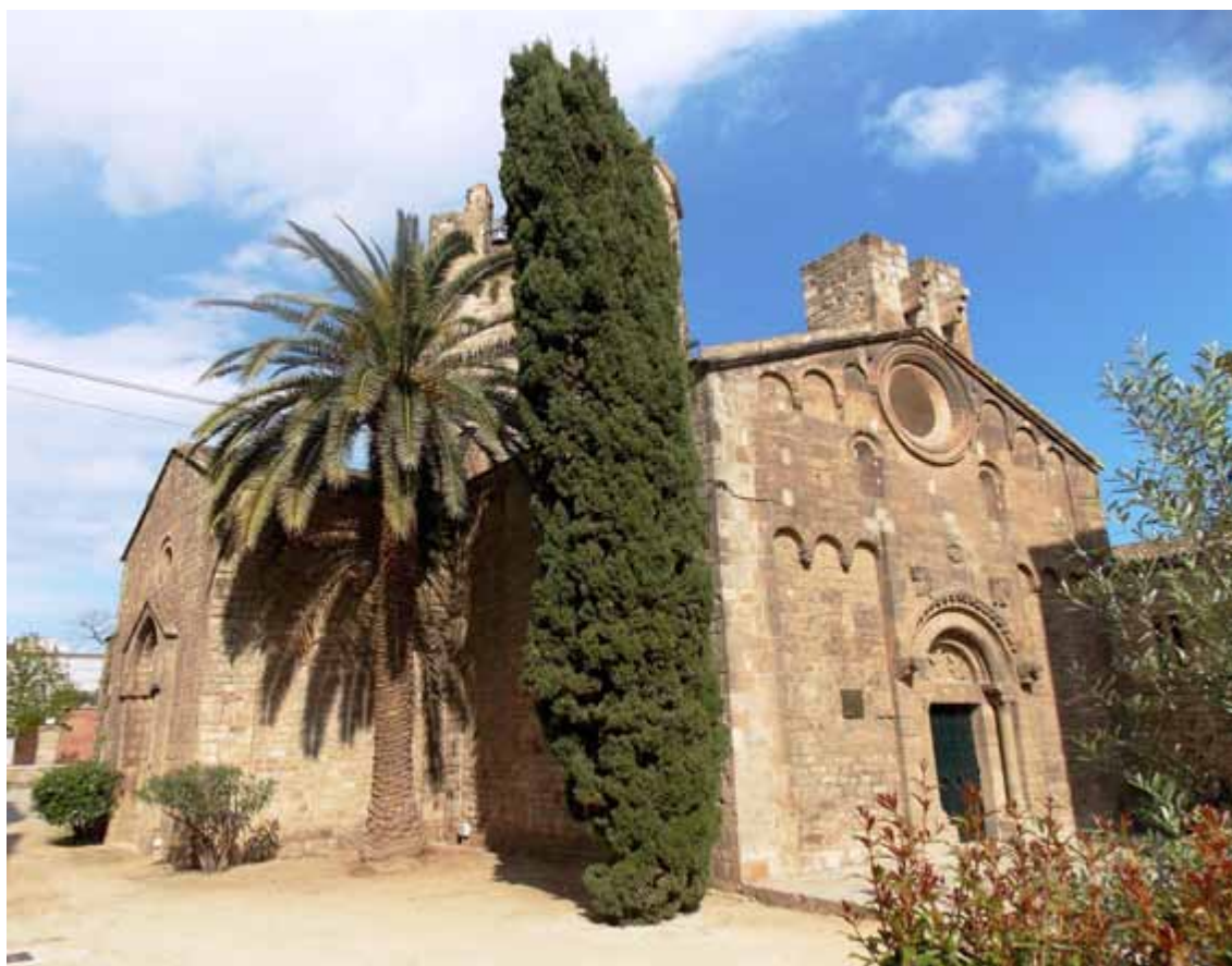
The Sant Pau del Camp church, in its garden surrounding.