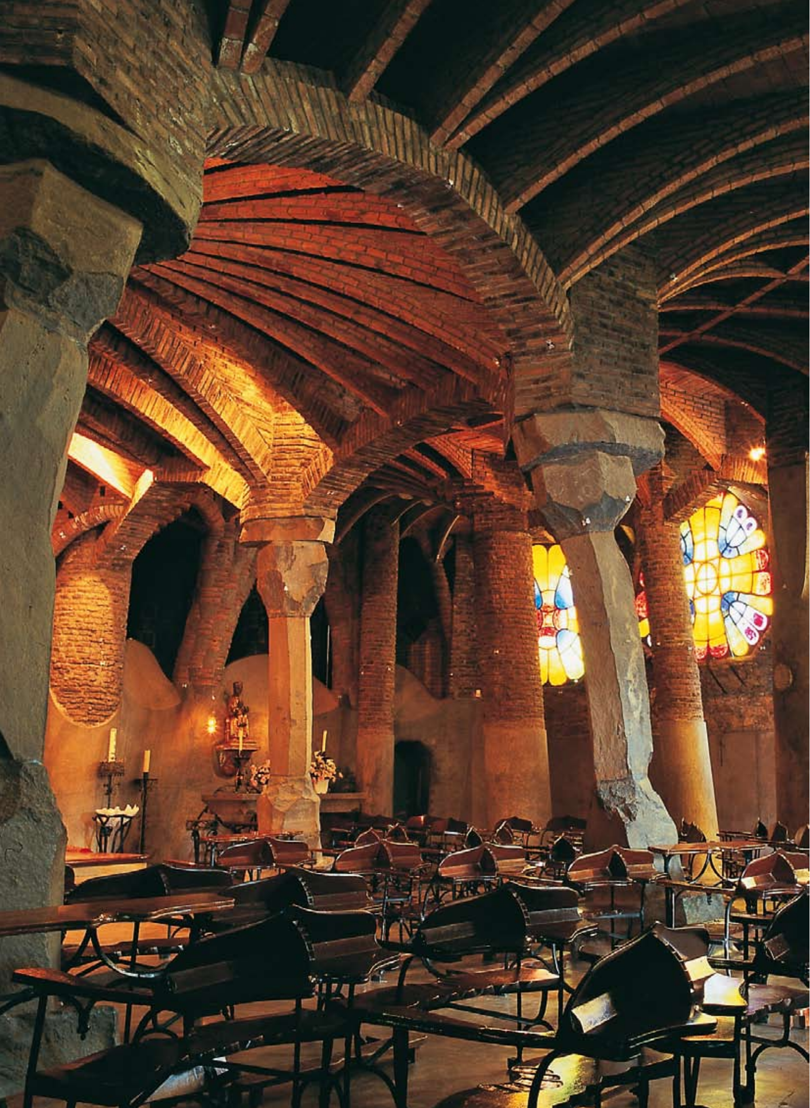
The Colònia Güell Crypt