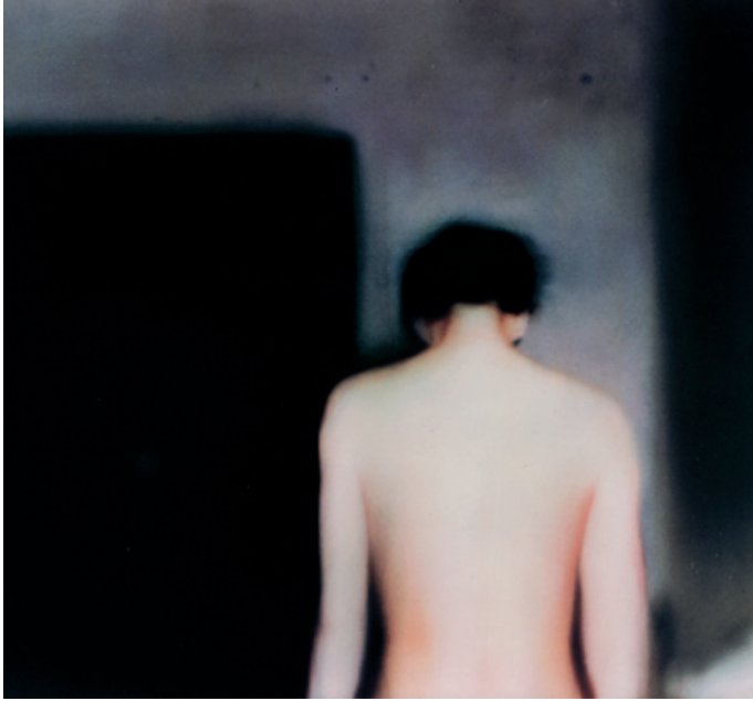
G. Richter - I.G. (790-3) - Óleo sobre tela, 1993

The “La Caixa” Contemporary Art Collection is one of the most important of its kind in Europe. A small gallery space of just 400 m 2 holds three-monthly rotating exhibitions of representative examples of works from the collection to provide a small-scale yet comprehensive overview of the history and trends in contemporary art. The collection, which covers the period from the mid-1980s to the present day, includes 900 key works from the Spanish and world art scene in a variety of disciplines, including painting, sculpture, photography, video and installations.