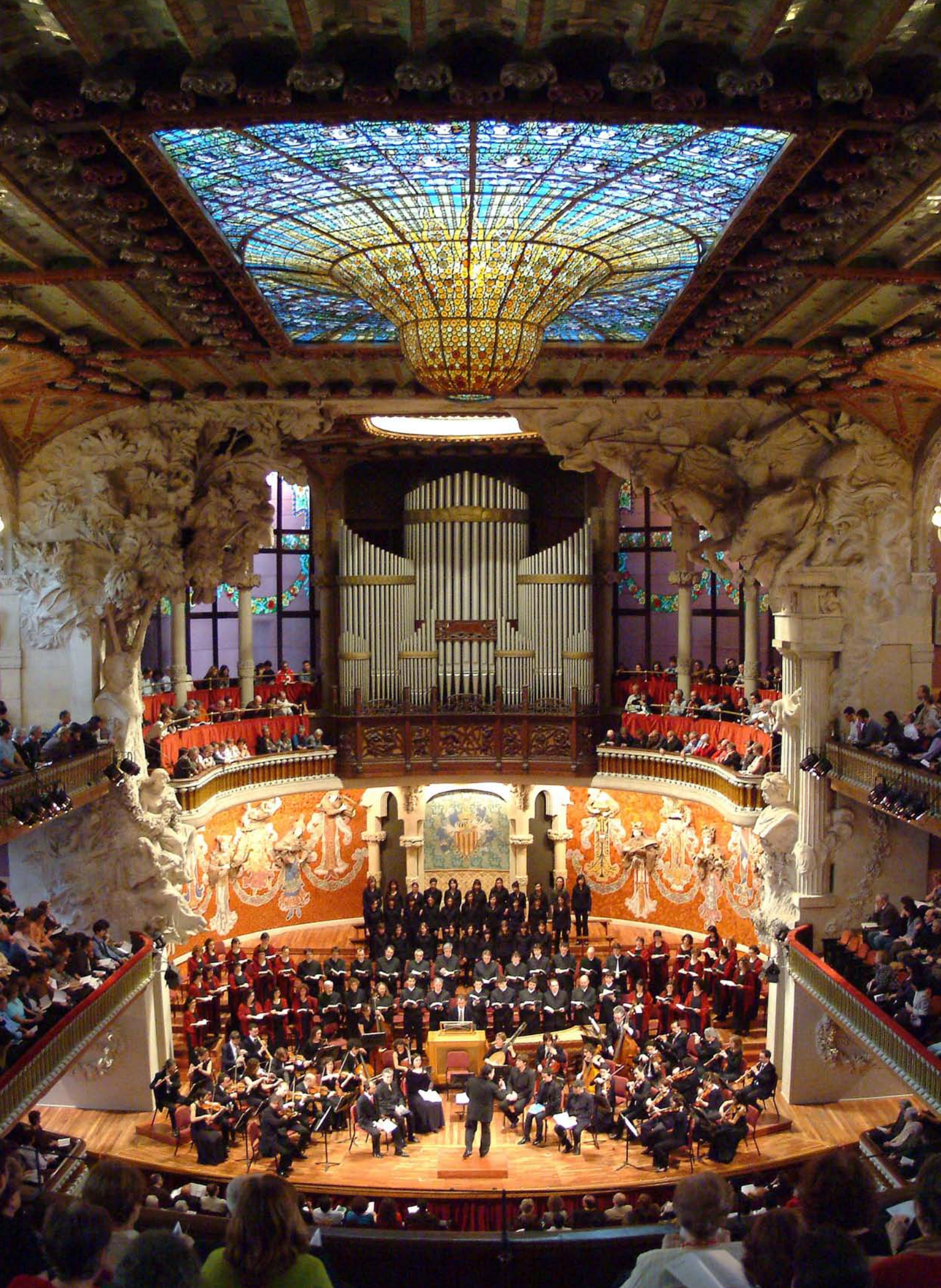
Palau de la Música Catalana. Concert hall