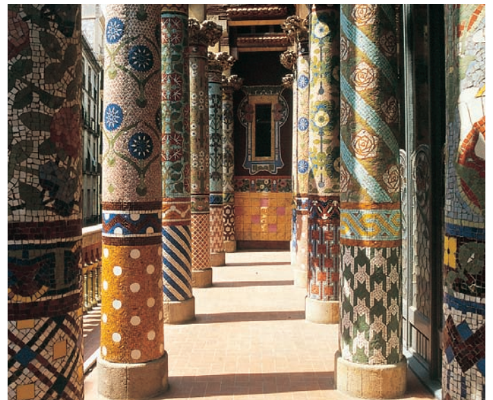
Columns of the main façade

Una vez dentro, en el vestíbulo, destaca el pórtico de dos arcos y, muy cerca, la antigua taquilla, decorada con colores suaves y motivos florales. Toda la entrada y las escaleras de mármol son una ofrenda al pensamiento, el techo de molduras de cerámica vidriada con dibujo geométrico formando estrellas. Más sobriedad transmite el foyer, con amplios arcos decorados con piezas de colores y flores, pero que nos permiten descubrir mejor la estrecha relación entre el ladrillo visto y los ornamentos.