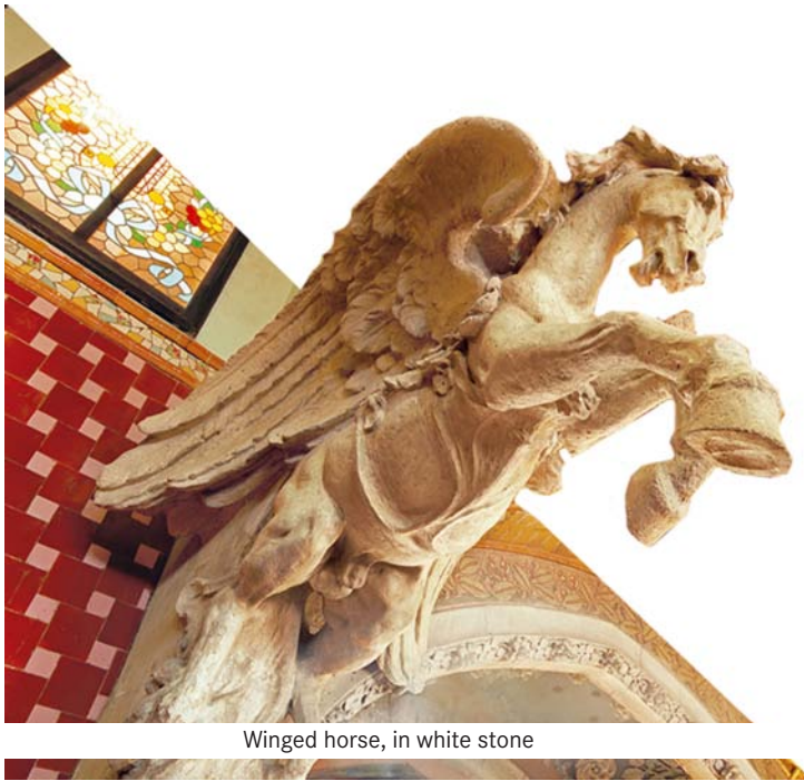
Winged horse, in white stone

Les escultures de dins del Palau de la Música semblen tenir veu i ànima. Contínuament evoquen el cant i la música, amb un component simbolista, com la representació del cavall alat Pegàs. Domènech i Montaner va destacar el cant coral en les representacions escultòriques, com ho demostra la imatge del mestre Josep Anselm Clavé, amb un grup de noies al pedestal, cantant. També en són exemple les escultures del gran arc de la boca de l'hemicicle, que representen la cavalcada de les valquíries de Wagner. També hi trobem un homenatge a la música clàssica en un bust de Beethoven. Però, l'obra culminant són les divuit figures de donzelles, plenes de gràcia amb refinats instruments.