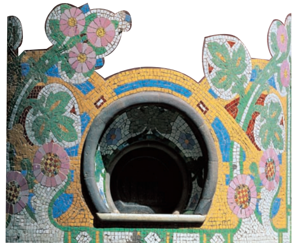
Original box office

The architectural beauty of the Palau de la Música Catalana is as enchanting outside as it is inside. As we approach the building, the façade of the Palau, presided over by busts of composers, captures our gaze. Set between the traditional houses in Barcelona's old town, it stands out between them thanks to the magnificent combination of exposed brickwork, stone, glazed ceramics, iron and glass created by the modernista architect Domènech i Montaner. The result is a unique monument which invites us to view it with curious eyes. The entire building contains references to music, such as the large sculptural ensemble Catalan folk song , by Miquel Blay, on the corner of the building. Once inside the building, in the lobby, our attention is drawn to the portico with its double arch and nearby, the original box office, decorated with floral motifs in soft colours. The entire entrance and marble staircase pay tribute to thought and contemplation, the ceiling with its glazed ceramic mouldings arranged in geometric star patterns. The foyer is more understated with its broad arches decorated with coloured ceramics and floral shapes, which reveal the close connection between exposed brickwork and the decorative elements.