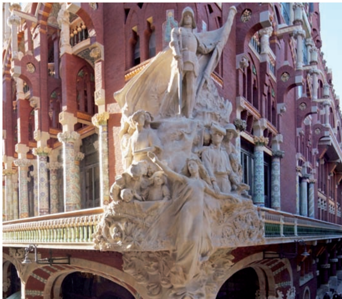
Allegory of La cançó popular catalana

La bellesa arquitectònica del Palau de la Música Catalana captiva tant des de fora com des de dins. Ja de bon principi, la façana del Palau, presidida per bustos de compositors, ens captiva la mirada. Enclavada entre les cases tradicionals del casc antic de Barcelona, sobresurt entre elles gràcies a la magnífica combinació que l'arquitecte modernista Domènech i Montaner va fer del maó vist, la pedra, la ceràmica vidriada, el ferro i el vidre. El resultat és un monument insòlit, que convida a contemplar-lo amb ulls encuriósits. Tot l'edifici conté referències a la música, com ara el gran grup escultòric La cançó popular catalana , obra de Miquel Blay, que fa de frontissa.