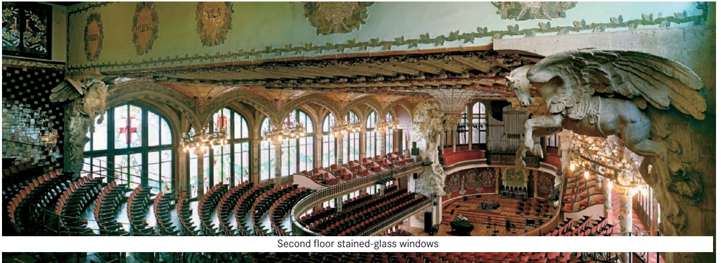
Second floor stained-glass windows

The Palau auditorium seems to have come out of a magic box. It is a rectangular, simple yet complex space where the contrasts are inevitably raised to the category of universal art, such as music and song. It is replete with ideas and imaginative architectural solutions. Once inside, the audience is transported to a fantasy world, filled with surprises and rhythms, where arches, colours, sculptures, columns and stained-glass windows exude a captivating beauty. Symbolic elements, such as the door at the side of the stage, provide a backdrop. Through here, the performers would enter, one by one, to form the great choir on stage.